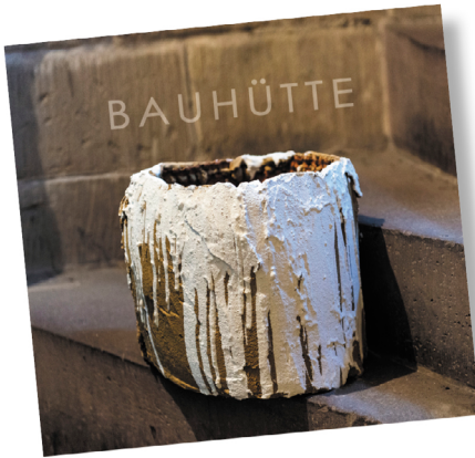
SUSANNE ALBRECHT INSTALLATION UND SKULPTUR